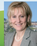
Nadine MORANO Secrétaire d'Etat chargée de la famille

Avec les conseils qui suivent, nous vous souhaitons, ainsi qu'à vos enfants, une année scolaire placée sous le signe de la confiance dans l'Internet.