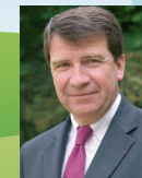
Xavier DARCOS Ministre de l'éducation nationale